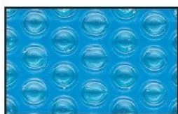
400 et 500 MICRONS BLEU