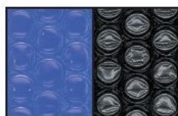
400 MICRONS BLEU/NOIR